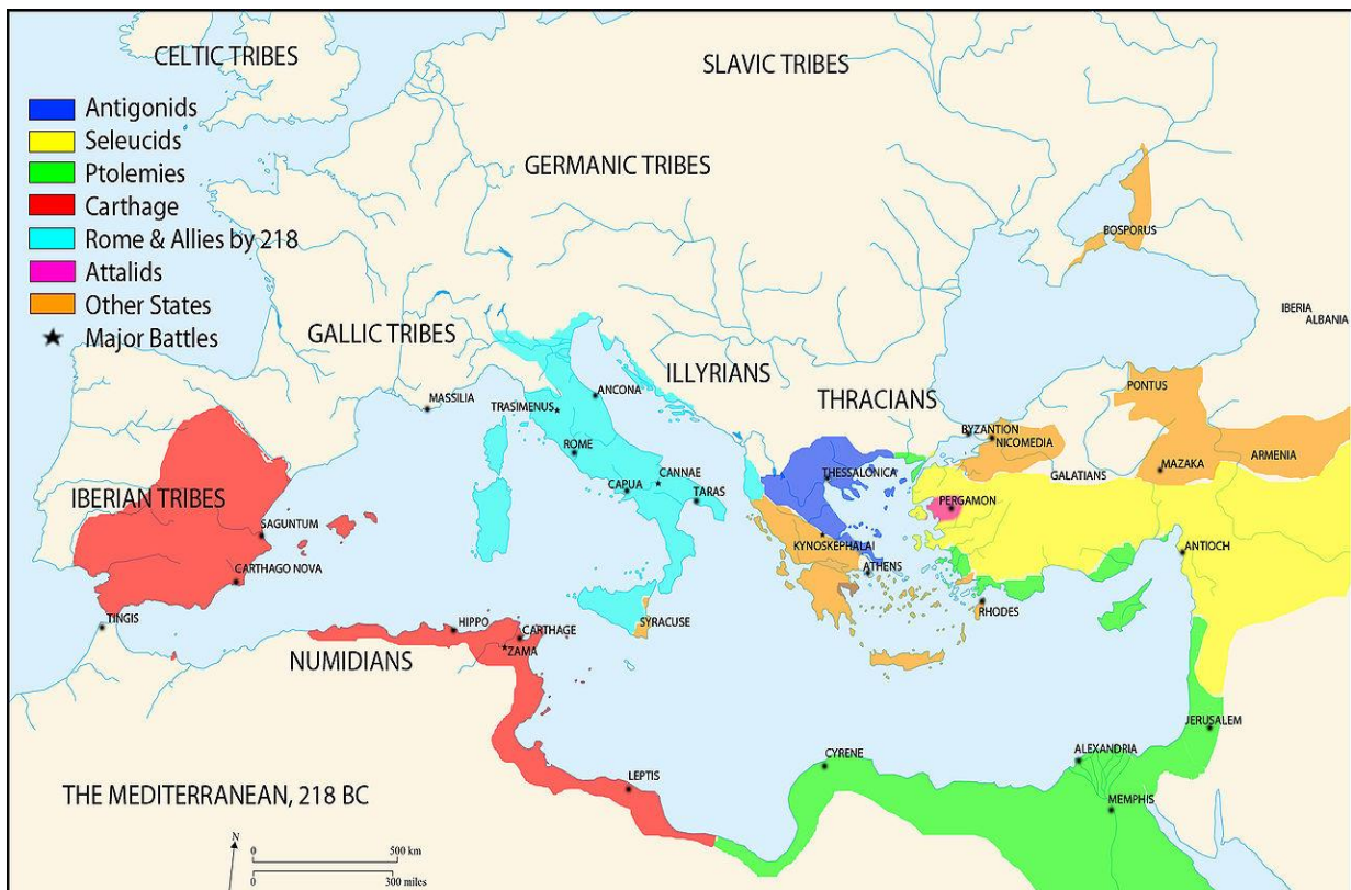
Kaart bij bron E: de Tweede Punische oorlog

Livius, Ab Urbe Condita ( AUC ) 26.41.10